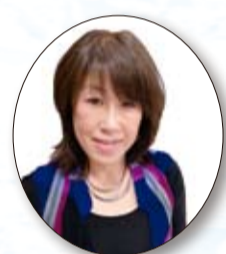
安東くるみ ビューティサロンはんしん (津山支部)