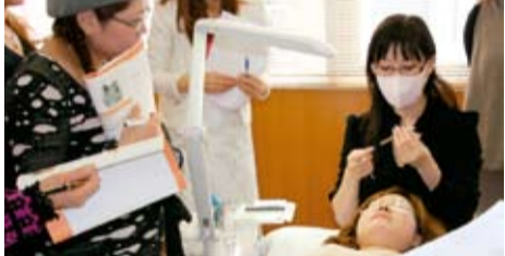
て、伝達講習をして頂く予定です。