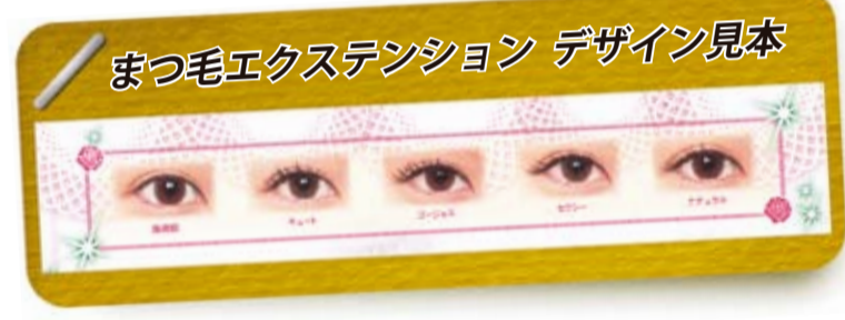
まつ毛エクステンション デザイン見本

モ・実技実習を受けて、伝達講習をして頂く予定です。 技術の面では、エクステのつけ方ひとつで、目のイメージがゴージャスだったりキュートであったり印象が随分変わることや、つけるまつ毛の選定の大切さなどを実感しました。 今後、受講生は更なる技術の習得に努めて頂き各県において、